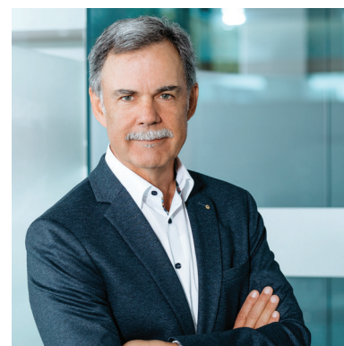
fidesda Büro Feldkirch

Es ist uns daher ein besonderes Anliegen, dass sich Bewährtes unter der neuen Marke fidesda nicht ändern wird , jedoch Synergien genutzt werden können, um gestärkt in die Zukunft zu gehen. Wir bedanken uns für das entgegengebrachte Vertrauen und freuen uns, wenn wir Sie weiterhin bei Ihren Versicherungsanliegen in gewohnter und bewährter Qualität begleiten dürfen, jedoch unter neuem Namen: