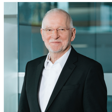
fidesda Büro Bludenz

Verstanden – Individuelle Versicherungslösungen für Private Klienten und Unternehmen